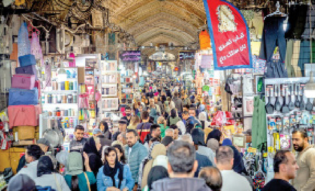
بازار ناکارآمد ارزان‌سازی در تهران، بهمن ماه ۱۴۰۴

باید به این نکته توجه کرد که اثرات سیاست‌های قهری زمانی که تورم بالا و انتظارات افزایش قیمت قوی است، محدود خواهد بود، چراکه انگیزه‌های اقتصادی تولیدکنندگان و توزیع‌کنندگان بر اساس وضعیت واقعی بازار تنظیم می‌شود، نه صرفاً بر اساس قیمت دستوری. بنابراین، برخورد با گران‌فروشان بدون رفع علتها (هزینه‌های تولید بالا، ارز کم، مقررات دست‌وپاگیر) تنها عاملی برای انتقال فشار به حلقه‌های عرضه یا ایجاد بازارهای زیرزمینی خواهد بود.