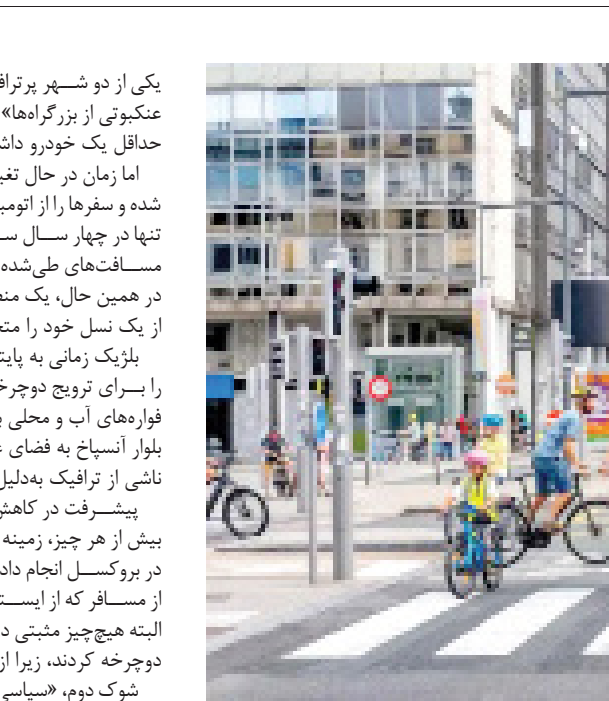
دوچرخه‌سواران در خیابان‌های تهران