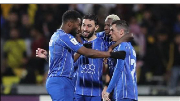
بازیکنان استقلال در جشن پیروزی