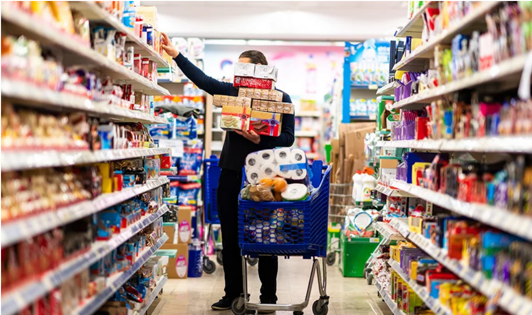
یک مرد در حال خرید از یک فروشگاه مواد غذایی در تهران.