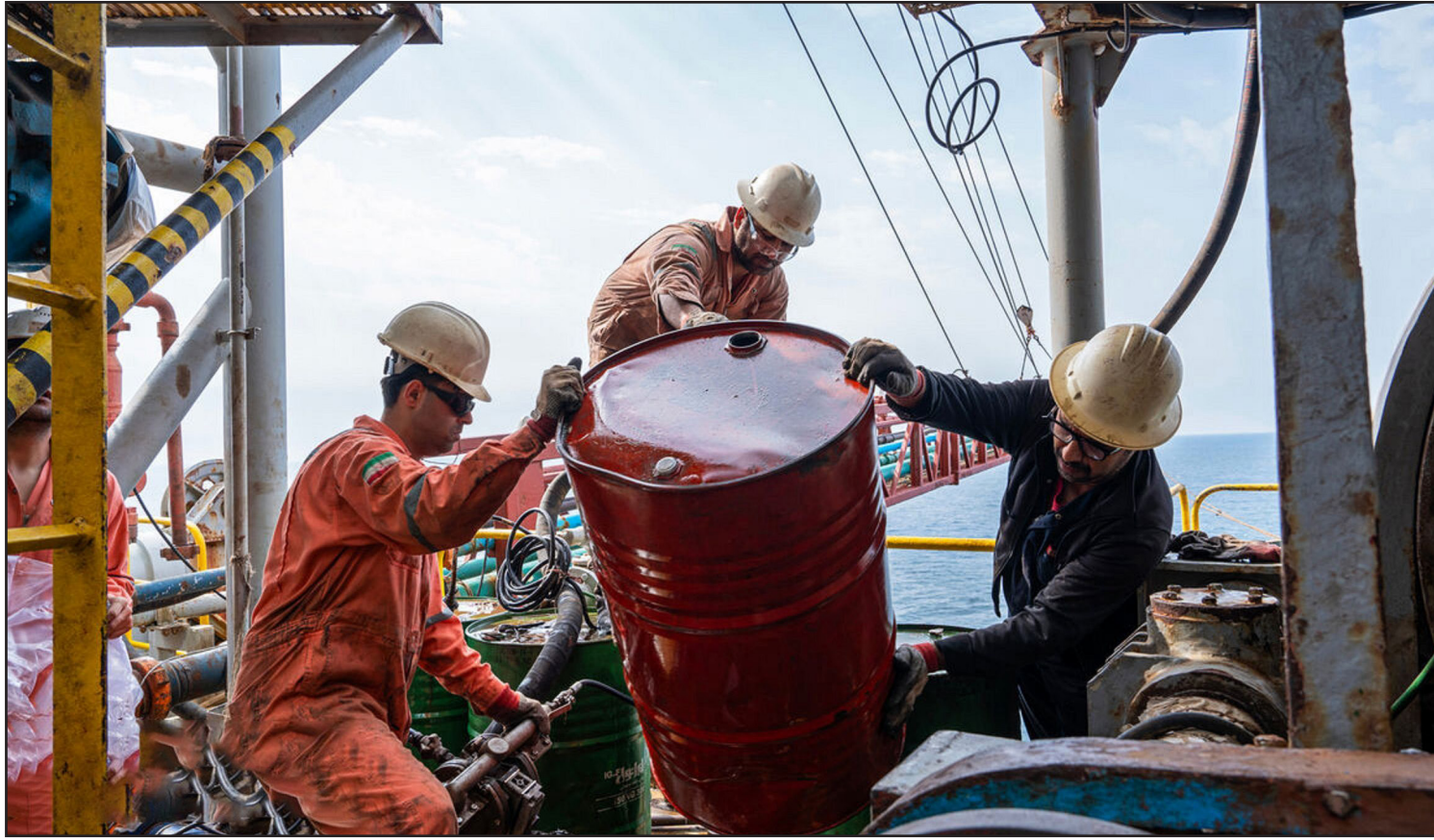
عکس: مرز اقتصاد